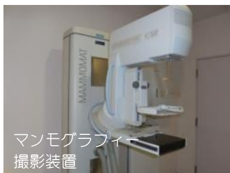
マンモグラフィー 撮影装置