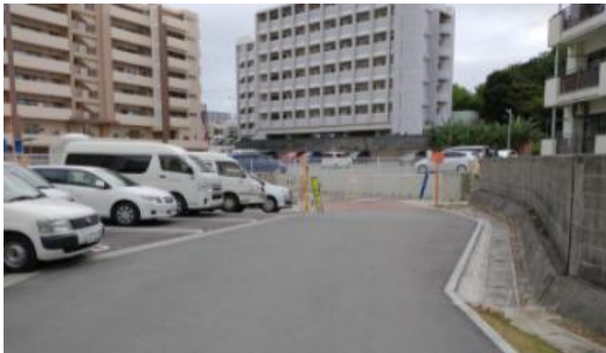
在宅部門を超えて左折し、 奥側が一般駐車場になります