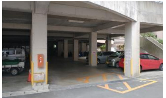
中庭側駐車場 (発熱外来専用)